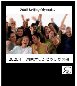
デジタルサイネージ